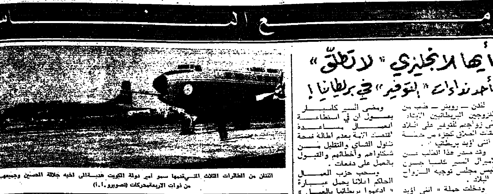
التفان من الطائرات الثلاث التي استخدمتها سمو امير دولة الكويت حياها الى اخيه جلالة الحسين وجيهه من ذوات الاربع محركات (تصوير 1.1)